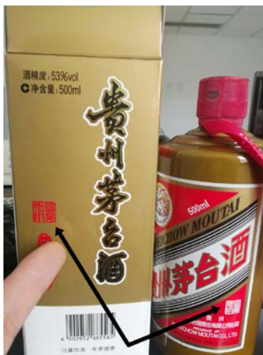
黑色箭头所指处标注“国宴专用”。

“今年中秋节前，为了招待朋友，我在天津国酒茅台有限公司以每瓶 3000 元的价格买了一箱‘国宴专用’茅台酒。朋友产生疑问，市场上怎么能够买到国宴专用酒？我回答不了。”消费者李先生说，“送走朋友后我上网查询，有报道说，在 2009 年十一届全国人大二次会议答中外记者问环节，有关部门负责人表示，多年前国宴进行了改革，不上白酒。”