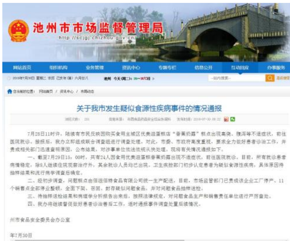
池州市市场监督管理局网站截图

中新网 7 月 30 日电 据安徽池州市市场监督管理局网站消息，池州市食品安全委员会办公室 30 日发布情况通报称，池州市发生疑似食源性疾病事件，截至 7 月 29 日 15 时，共有 24 人前往医院就诊。