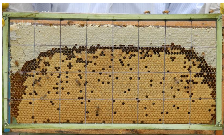
图 11 方格法测定蜂王有效产卵数量

因此，提出蜂王日均有效产卵量测定方法：“在蜜蜂繁殖期，用方格网（西方蜜蜂 5 cm×5 cm 方格网，东方蜜蜂 4.4 cm×4.4 cm 方格网，每个方格中约含有 100 个巢房）测量蜂王日均有效产卵量，即测量蜂群内所有封盖子的数量，西方蜜蜂每隔 12 d 测一次，东方蜜蜂每隔 11 d 测一次，连续测量三次，统计所有子脾封盖子数量总和，则为蜂王的有效产卵量，再计算出蜂王日均有效产卵量。西方蜜蜂蜂王日均有效产卵量 \geq 1500 粒为授精优秀等级，东方蜜蜂蜂王日均有效产卵量 \geq 600 粒为授精优秀等级。”