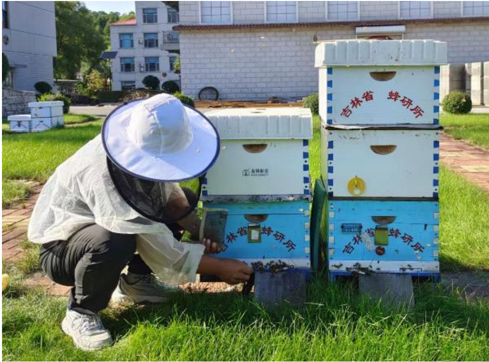
图 2 蜂箱前捕捉雄蜂