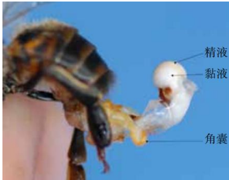
图3 性成熟雄蜂阳茎外翻，示精液