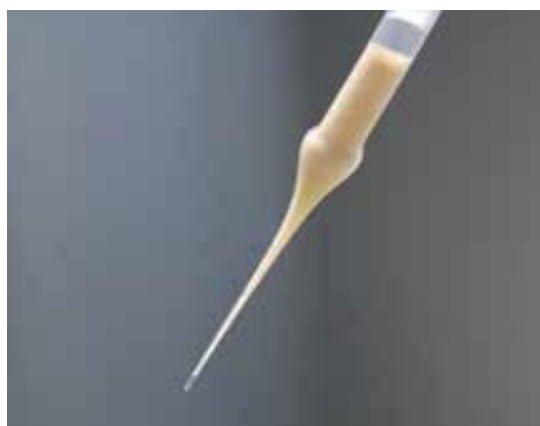
图5 针头内采集的雄蜂精液和气泡

深层，容易吸入黏液。虽然每只西方蜜蜂雄蜂最多有 1.5~1.7 \mu\text{L} 的精液附在黏液表面，但是实际上只能采集到 1.0 \mu\text{L} 左右（东方蜜蜂精液量 0.3 \mu\text{L} /只），很容易吸入黏液。因此，在采集下一只雄蜂精液时，将采集的前一只雄蜂精液推出针尖外一部分，使其与准备采集的精液面相接触后再吸入，这样既可以防止采精时吸入空气，又可以减少吸入黏液的机会。一旦发现吸入黏液时要尽快排出，哪怕是稀黏液也不可以混进精液吸入针头。因为黏液不仅会堵塞针头，如果注射到蜂王侧输卵管后会凝固而堵塞输卵管，这样不仅影响了精子进入受精囊，而且还会造成蜂王死亡。采集精液结束时，针头内仍然要吸入一段空气，然后用生理液封口，以免纤细的针头因精液的凝固而堵塞。雄蜂精液储存时间越久，光照时间越长，精子活力越低，受精能力越差。精液采出后常温贮存 2 d，仍然可以用于蜜蜂保种工作。