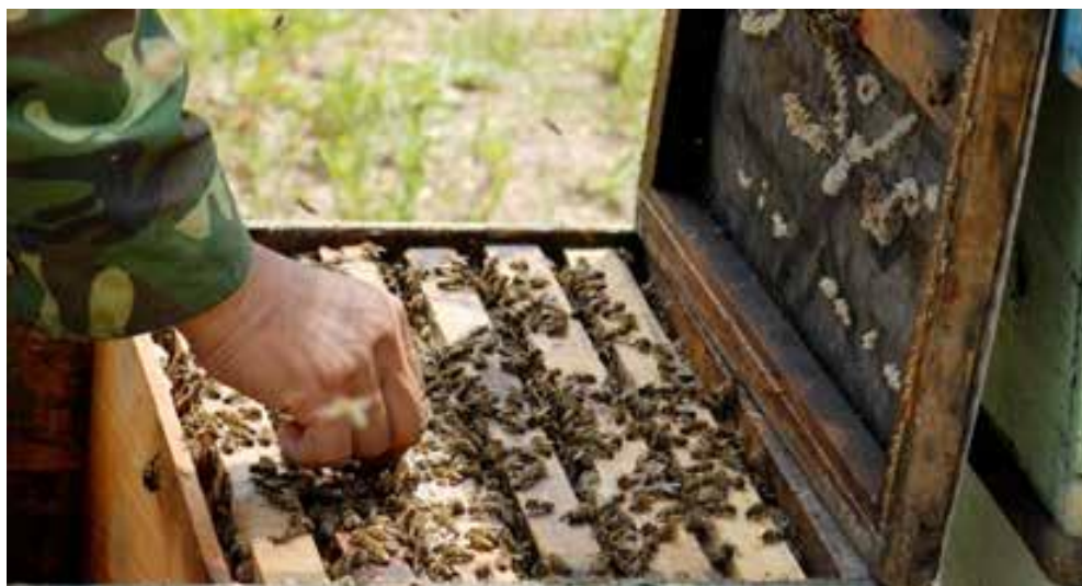
图 1 蜂巢内捕捉雄蜂

试验验证结果：上午，边脾和框梁上的雄蜂性成熟比例显著高于巢脾内部；下午，巢门处返回的雄蜂体内既无粪便排泄，性成熟比例又显著高于蜂巢内雄蜂。因此，确定“5.1 雄蜂捕捉 选择出房 12 d 后且带有标记的雄蜂。上午捕捉时，应从蜂群的边脾和框梁上选择粗壮、行动敏捷的雄蜂，将其放入飞翔笼内；下午捕捉时，应在巢门口选择飞翔后归巢的雄蜂。”