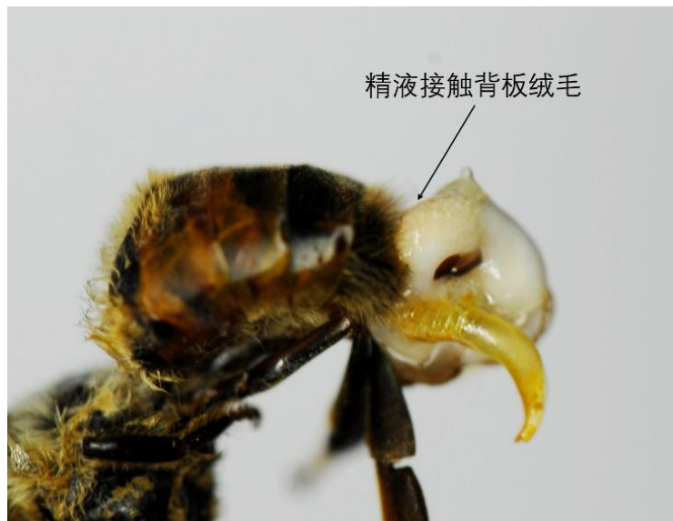
图4 雄蜂阳茎外翻，示精液污染