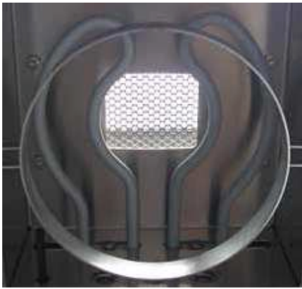
获红点设计大奖的AURI加热源

借助其经过优化的加热元件——赛多利斯全新的AURI合金加热源，MA160可实现高速测量，与传统红外水分测定仪相比，测量时间缩短一半以上。而MA160的称重系统也是由此来保证要求的精度。